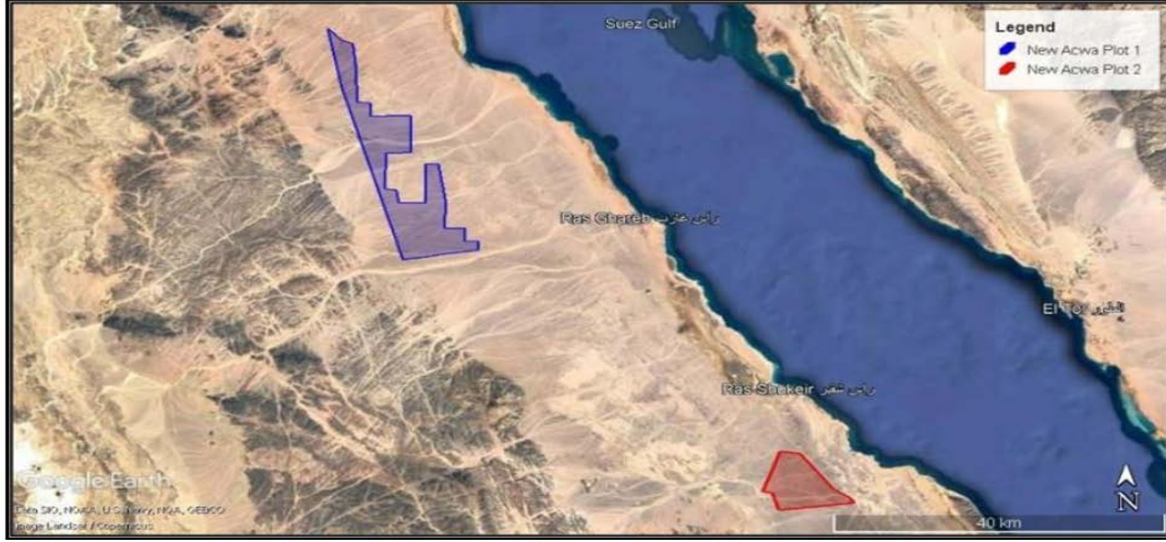
الشكل 1: موقع المشروع (القطعة 1 باللون الأزرق)

منطقة المشروع والمنطقة العازلة، على الرغم من ملاحظة أعداد كبيرة من الطيور المحلقة المهاجرة التي تحلق فوق الموقع. يبدو أن الموئل في الموقع موطن طبيعي على نطاق واسع. وتعتبر إحدى الزواحف، السحلية شوكية الذيل المصرية (شديدة التعرض للانقراض)، وأربعة أنواع من الطيور المهاجرة اللقلق الأبيض، اللقلق الأسود، والبجع الأبيض الكبير، حوام العسل الأوروبي، صقر الغروب، الرخمة المصرية، ملكة العقبان الشرقية، عقاب صرارة، الباشق وعقاب السهول، من سمات التنوع البيولوجي ذات الأولوية وستكون محور تقرير خطة إدارة التنوع البيولوجي هذه.