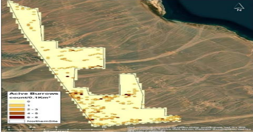
الشكل 3: جحور السحلية شوكية الذيل المصرية (سيركلس) داخل موقع المشروع

أو علامات جر أو علامات حفر حديثة عند المدخل)، أو غير نشطة. يوضح الشكل 3 موقع الجحور النشطة التي تم تحديدها.